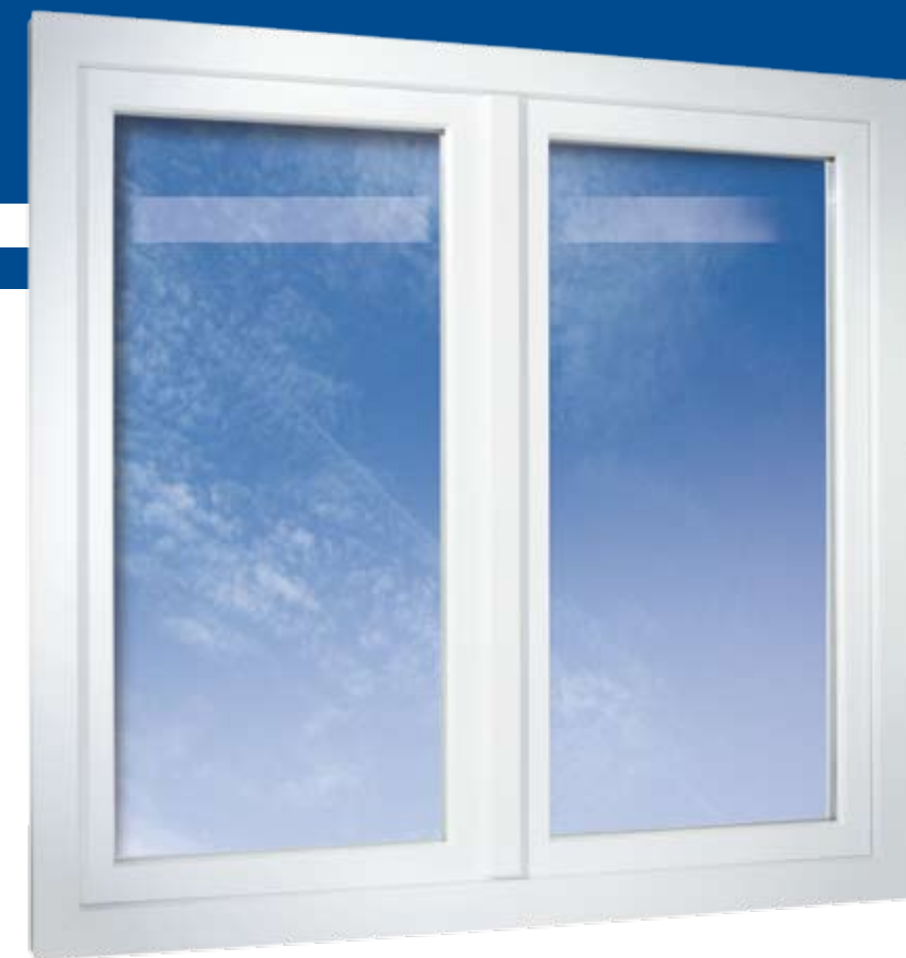
2-křídlové okno s rámem plošně odsazeným